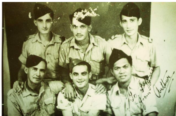
Photos souvenirs des anciens combattants polynésiens du Bataillon du Pacifique