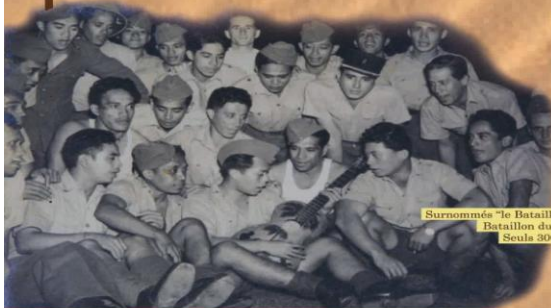
Surnommés « le Bataillon des guitaristes », les 600 volontaires du Bataillon du Pacifique ont mené de rudes batailles. Seuls 300 d'entre eux ont survécu.

Conception: Bureau de la communication interministérielle, Cabinet du Haut-Commissaire de la République en Polynésie Française avec le concours de FONAC Polynésie - Maquette: Céline Cassaban